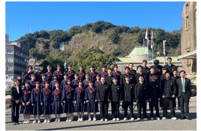
【宝山ホール前での集合写真】